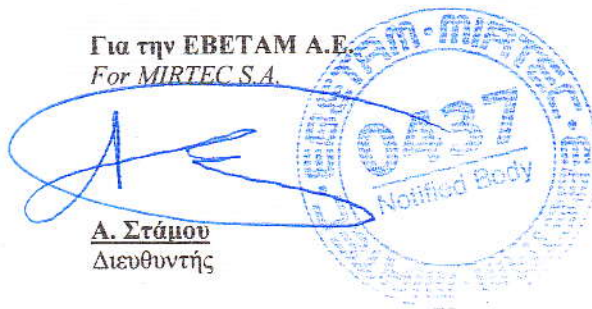
Α. Στάμου Διευθυντής